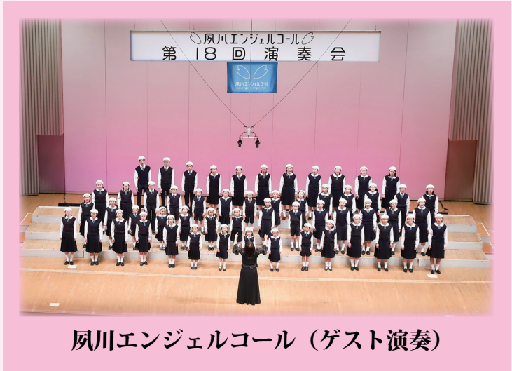
夙川エンジェルコール (ゲスト演奏)